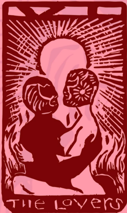
Arcano Mayor 6 - Los Enamorados. Carlos Flores ROM: Carpeta Arcanos Poblanos, 2022. Linografía o Linograbado Col. Museo Taller Erasto Cortés, Puebla, México.