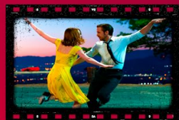
La La Land 24 de febrero

MUSEO DEL AUTOMÓVIL PUEBLA Bulevar Esteban de Antuñano #36, esquina Calle Francisco Villa, Col. Luz Obrera, Puebla, Pue.