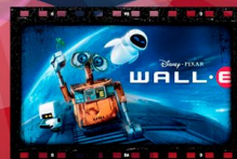
WALL-E 25 de febrero

MUSEO DEL AUTOMÓVIL PUEBLA Bulevar Esteban de Antuñano #36, esquina Calle Francisco Villa, Col. Luz Obrera, Puebla, Pue.