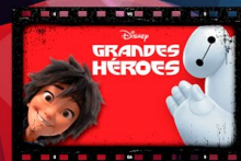
Grandes héroes 18 de febrero