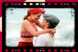
Diario de una pasión 17 de febrero