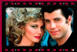
Vaselina 10 de febrero