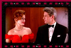
Mujer bonita 03 de febrero

*Tu boleto de acceso incluye esta actividad *Programación sujeta a cambios sin previo aviso